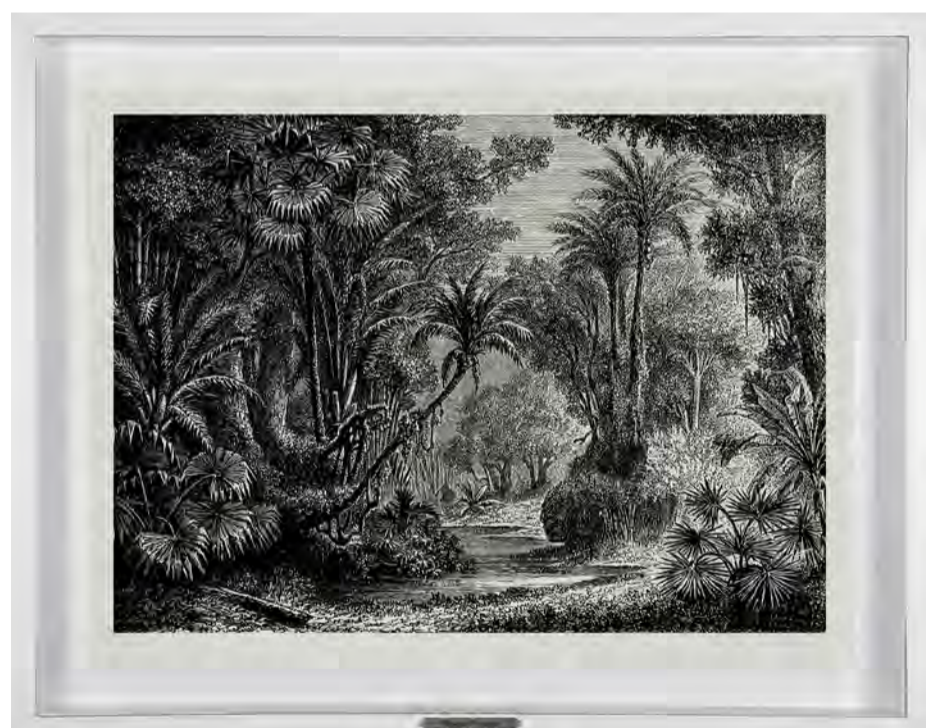
Sem título. Paisagem 08 Da série Memória das Plantas, 2024 Petróleo e carvão sobre papel Arches 640 g. 72 x 92 x 4 cm.