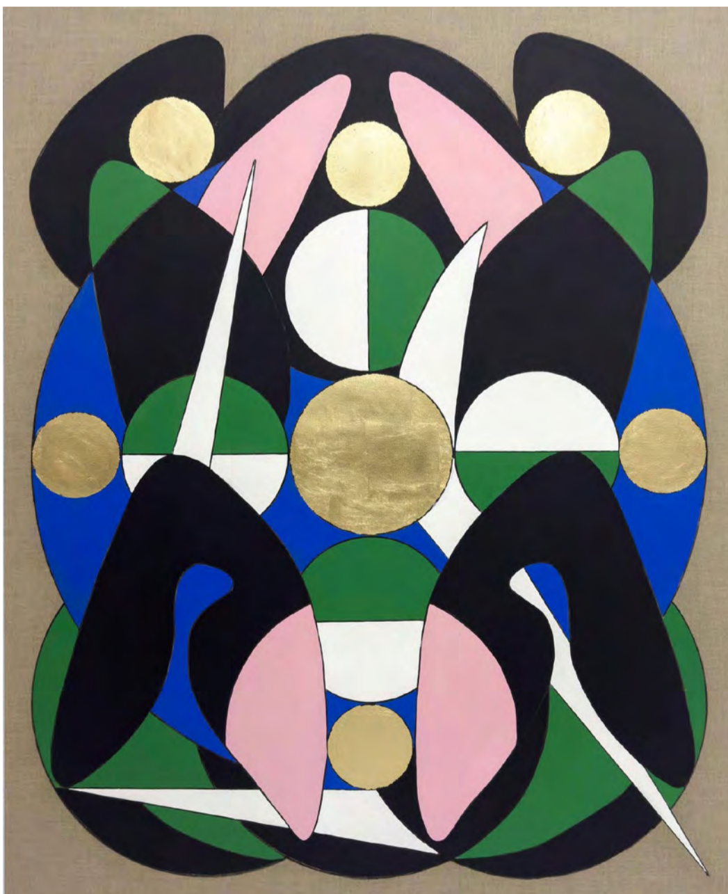
Pherusa n° 3 2024 Carvão, folha de ouro (imitação) e acrílico sobre linho 162 x 130 cm.

A arquitetura, a forma, a cor, a escultura, a memória e a psicologia são, pois, os alicerces sobre os quais assenta a obra de Óscar Abraham Pabón. Este artista começou a participar em bienais e projetos públicos na América Latina e na Europa ainda muito jovem, e o seu trabalho está representado em algumas das coleções mais importantes da América Latina, como a Coleção Ella Fontanals-Cisneros CIFO, a Coleção do Pérez Art Museum Miami, a Coleção Patricia Phelps de Cisneros em Nova Iorque, a Coleção C&FE em Caracas e a Casa Steinworth em San Cristóbal, Venezuela.