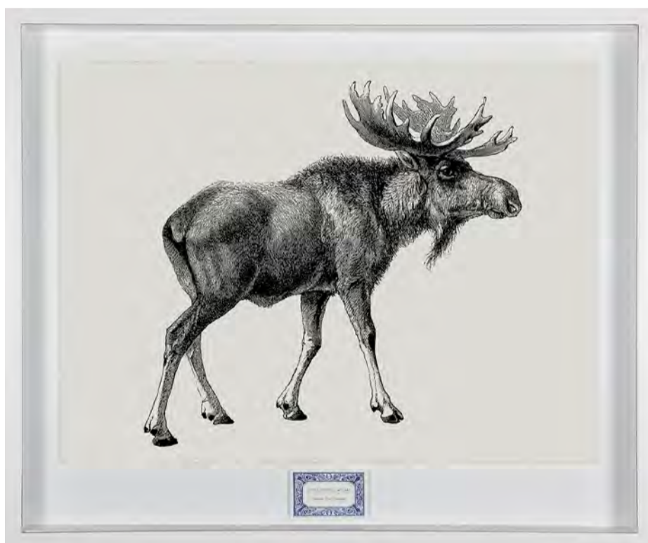
Sem título. Alce americano. Da série História Natural do Futuro, 2025 Petróleo e carvão em papel Arches 640 g. 72 x 92 x 4 cm.