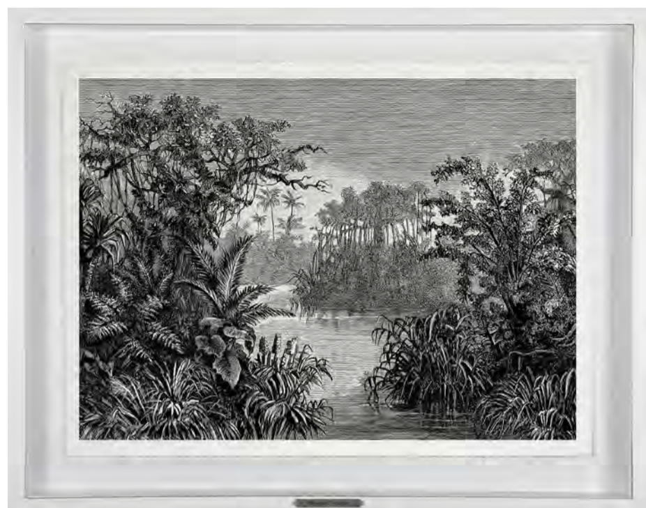
Sem título. Paisagem 07 Da série Memória das Plantas, 2024 Petróleo e carvão sobre papel Arches 640 g. 72 x 92 x 4 cm.