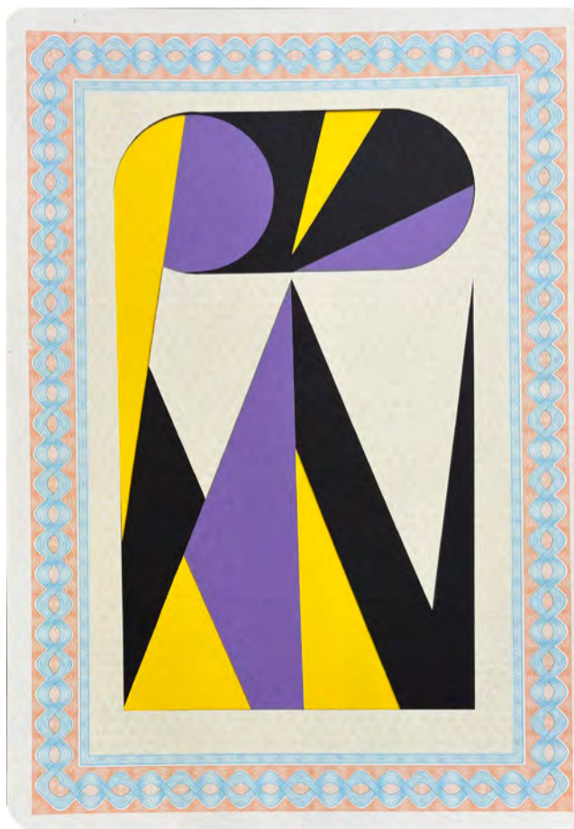
Artesanato Moderno OA 07 2025 Papel para diploma em cartolina colorida 29 x 21 cm.