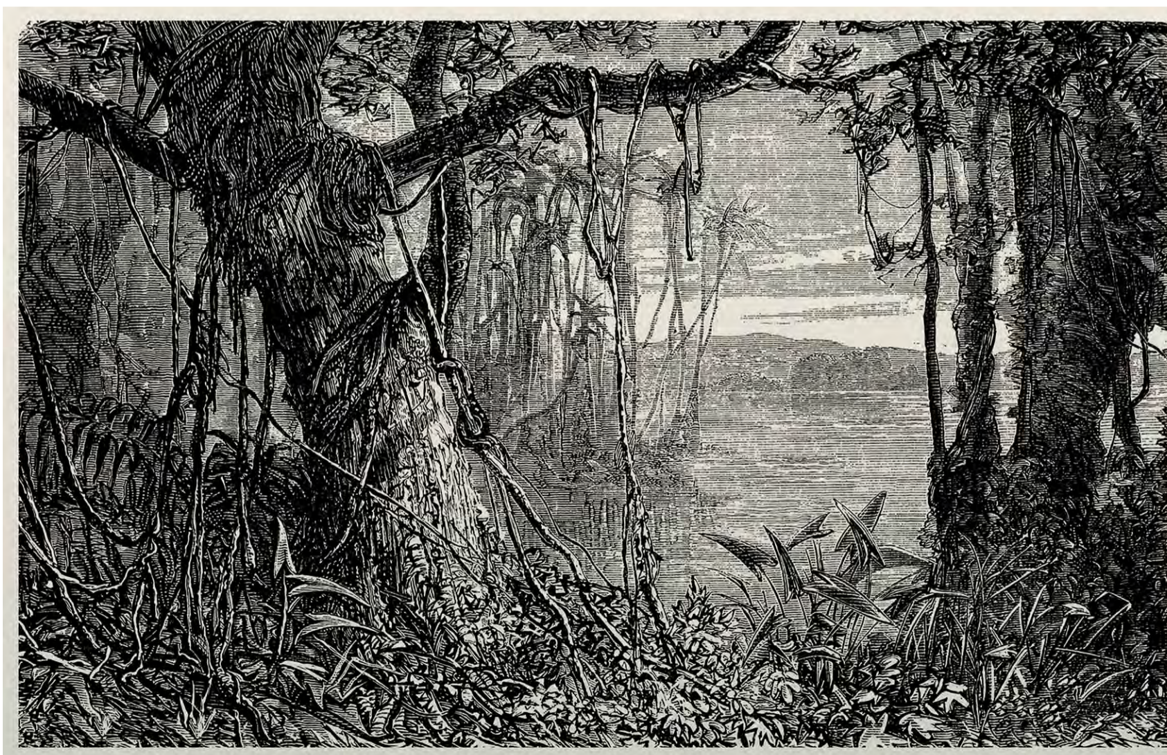
Sem título. Paisagem 01 Da série Memória das Plantas, 2025 Óleo e carvão sobre tela 100 x 150 cm.

Edwin Monsalve vive e trabalha em Medellín, na Colômbia. Em 2017, foi galardoado com o Prémio de Aquisição do EFG Latin American Art Award em associação com a ArtNexus, um dos mais prestigiados prémios que apoiam a produção de artes visuais por artistas latino-americanos contemporâneos. O seu trabalho foi exposto em vários museus e instituições colombianas, incluindo o Museu de Arte do Banco da República em Bogotá, o Museu de Antioquia em Medellín e a Fundação Gilberto Álzate Avendaño em Bogotá, onde, em 2016, apresentou o seu projeto site-specific Narcissus, vencedor do 4º Prémio Bienal de Artes Visuais e Plásticas. Em 2020, foi convidado pelo curador Juan Canela para apresentar um projeto individual na edição de 2020 da ZONA MACO SUR, exibindo o projeto Power Structures (2019-2020). Atualmente, leciona na Universidade de Antioquia.