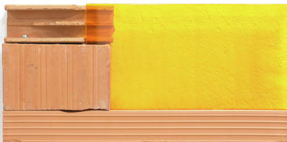
Reciclagem (IX) 2022 Pedacos de tijolo, metacrilato, haste metálica e parafuso 20 x 50 x 4 cm.