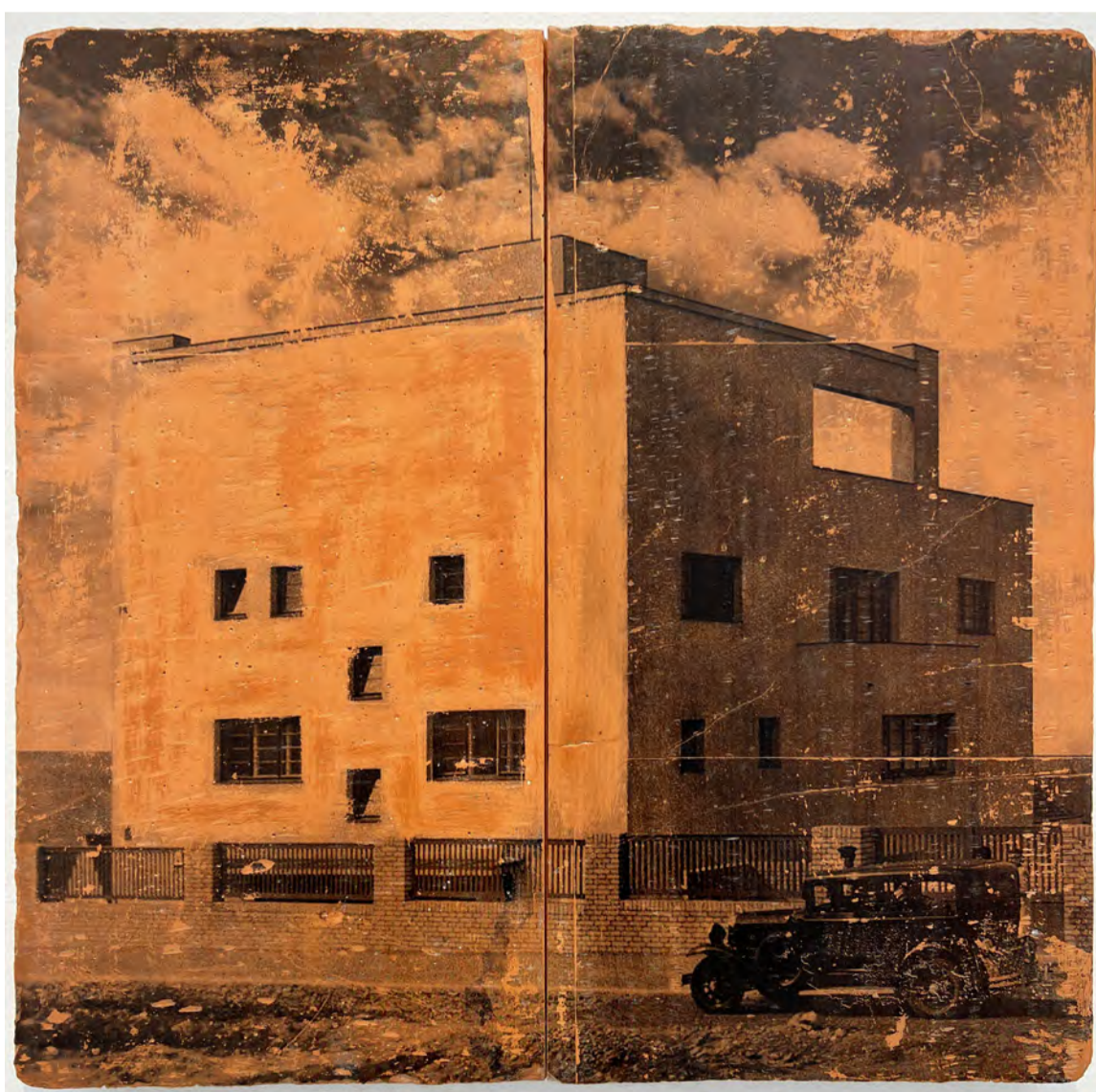
Narciso n° 2 2022 Tijolos e espelho em metacrilato dourado 63 x 60 x 4 cm.