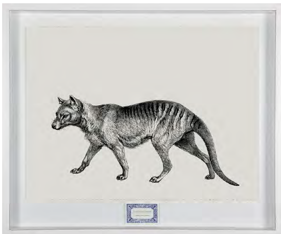
Sem título. Tigre-da-tasmânia. Da série História Natural do Futuro, 2025 Petróleo e carvão em papel Arches 640 g. 72 x 92 x 4 cm.