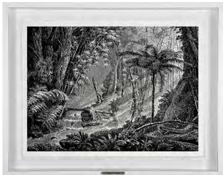
Sem título. Paisagem 06 Da série Memória das Plantas, 2024 Petróleo e carvão sobre papel Arches 640 g. 72 x 92 x 4 cm.