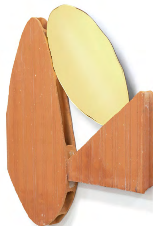
Narciso nº 2 2022 Tijolos e espelho em metacrilato dourado 63 x 60 x 4 cm.