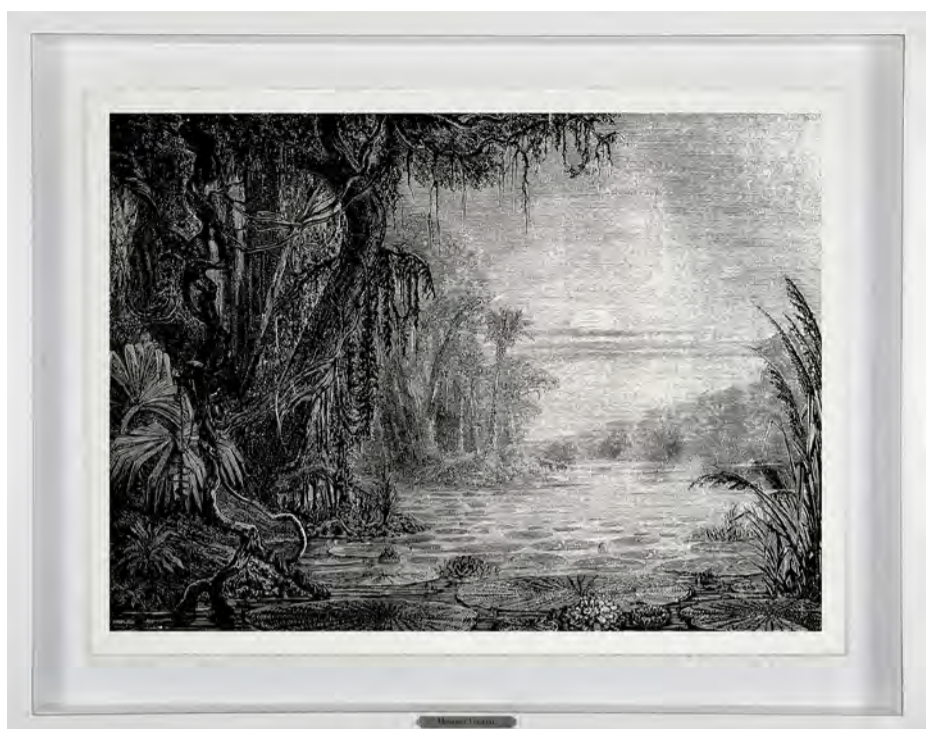
Sem título. Paisagem 05 Da série Memória das Plantas, 2024 Petróleo e carvão sobre papel Arches 640 g. 72 x 92 x 4 cm.