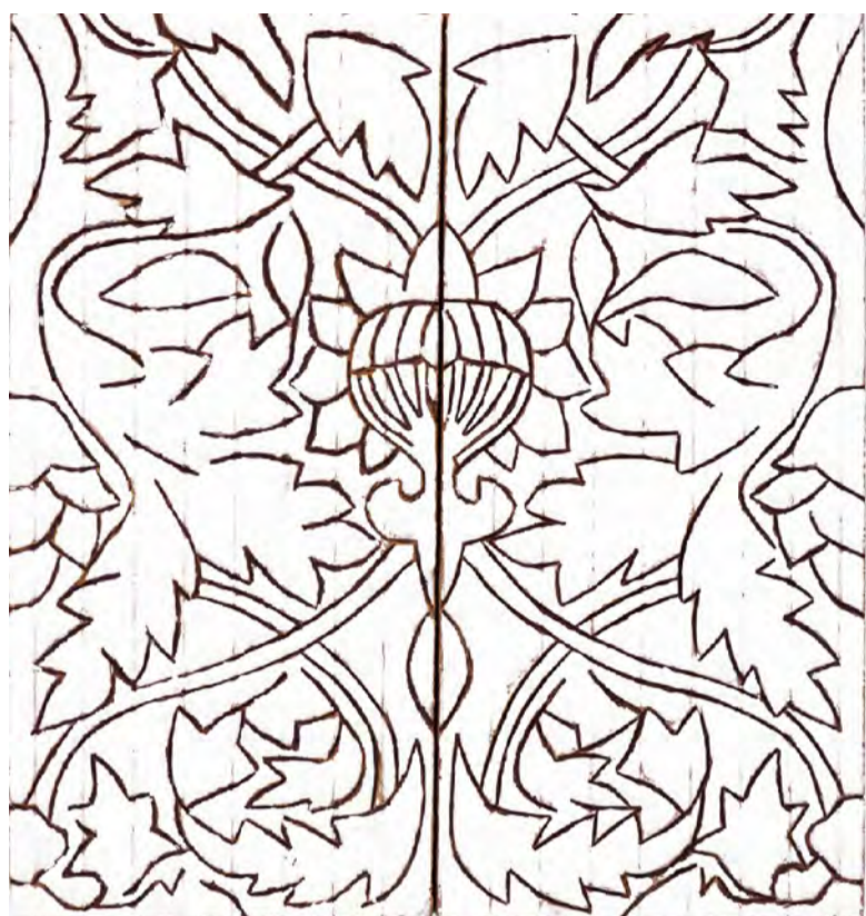
Ornamento e Decoração n° 3 2021 Cerâmica vidrada 32,5 x 31 x 7 cm.