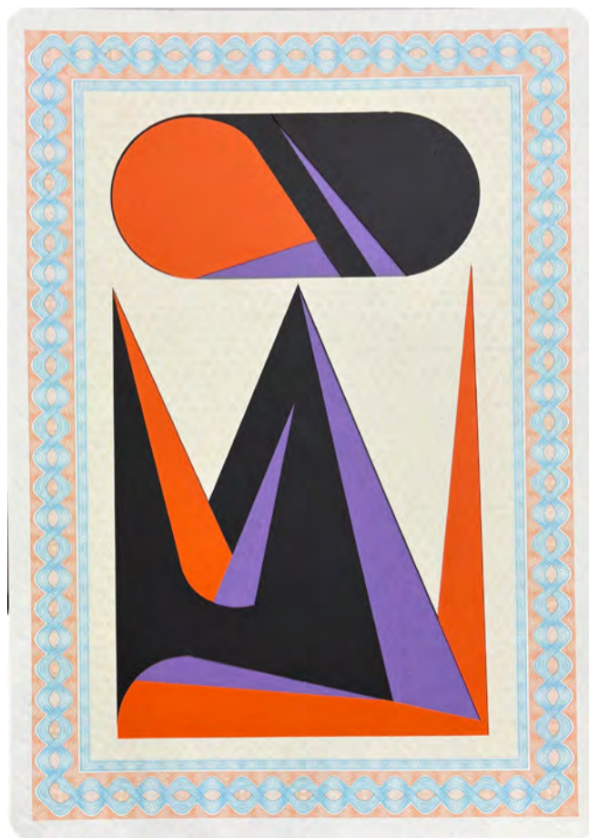
Artesanato Moderno OA5 2025 Papel para diploma em cartolina colorida 29 x 21 cm.

Arquitectura, forma, color, escultura, memoria y psicología son por tanto, las bases sobre las que se sustenta la obra de Óscar Abraham Pabón, artista que comenzó muy temprano a participar en Bienales y proyectos públicos en Hispanoamérica y Europa y cuya obra está representada en algunas de las colecciones más sobresalientes del ámbito latinoamericano como la Colección Ella Fontanals-Cisneros CIFO, la del Pérez Art Museum de Miami, Patricia Phelps de Cisneros, Nueva York, la Colección C&FE de Caracas y Casa Steinworth de San Cristóbal, Venezuela.